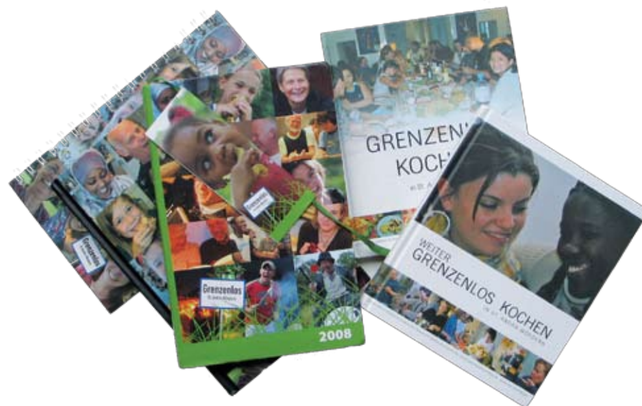
Kalender & Kochbücher

Projektbeschreibungen unter www.grenzenloskochen.at